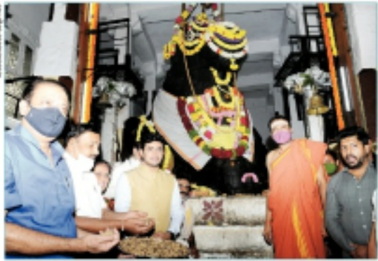
ಬಸವರೂಪಿ ದೊಡ್ಡ ಗಣಪತಿ ದೇಗುಲದಲ್ಲಿ ನಡೆದ ಸಾಂಕೇತಿಕ ಕಡಲೆಕಾಯಿ ಪರಿಷೆಯಲ್ಲಿ ಸಂತರ ಶಿಬಿರವಿರಲಿಲ್ಲ. ಕಾರಣವೇ ಅದೇನು ಗಣಪತಿಗಳಿಗೆ, ದೆವಿಸುಭಿಷಣ ಇದ್ದರು.

■ ಕೊಂಕಣಿ ಸುಭಿಷಣ ವೆಂಗಳೂರು ಬಸವರೂಪಿಯ ದೊಡ್ಡಗಣಪತಿ ದೇಗುಲದ ಬಳಿ ಪ್ರತಿವರ್ಷ ಕೊಂಕಣಿ ಕಾರ್ತಿಕ ಸೋಮವಾರ ಅದ್ವೈತಿಯಾಗಿ ನಡೆಯುತ್ತಿದ್ದ ಕಡಲೆಕಾಯಿ ಪರಿಷೆಯನ್ನು ಈ ವಾರ ಕರೊನಾ ಕಾರಣ ಸರಳವಾಗಿ ಆಚರಿಸಲಾಯಿತು. ಗಣಪತಿಗೆ ದೀಪ್ತ ಅಲಂಕಾರ ಮಾಡಿ, ಬಹು ಮಂಗಳವಾಗಿ ಮೂಲಕ ಪೂಜೆ ನೆರವೇರಿಸಲಾಯಿತು. ■ ದೊಡ್ಡ ಗಣಪತಿ ದೇವಸ್ಥಾನ ರಸ್ತೆಗಳಲ್ಲಿ ನಡೆಯಲಿಲ್ಲ ವ್ಯಾಪಾರ ನಗರವೇರಿಸಲಾಯಿತು. ಕಡಲೆಕಾಯಿ ಇಲ್ಲದ ಪರಿಷೆ: ಪ್ರತಿ ವರ್ಷ ಕೋಲಾರ, ರಾಮನಗರ, ಮಂಜ್ಯ, ತುಮಕೂರು, ಚಿತ್ರದುರ್ಗ, ಚಿಕ್ಕಬಳ್ಳಾಪುರ ಇಲ್ಲಿಗೂ ಹಾಗೂ ತಮಿಳುನಾಡಿನಿಂದ ಭಕ್ತರು ಮತ್ತು ವ್ಯಾಪಾರಿಗಳು ಕಡಲೆಕಾಯಿ ಮಾಡಲು ಬರುತ್ತಿದ್ದರು. ಕೂಡಲೆ ದಾರದವರೆಗೆ ಅಡ್ಡಿಯ ವಾಹನವಿಲ್ಲ ಮೈದೆಯುತ್ತಿತ್ತು. ಆದರೆ, ಈ ಸು ಪರೀಕ್ಷಾ ಕಾಲದಿಂದ ಕಡಲೆಕಾಯಿ ಮಾಡಲು ಮತ್ತು ಇತರ ಯಾವುದೇ ವ್ಯಾಪಾರ ಮಾಡಲು ಗಡುಸ್ತಿಯಾಗಿತ್ತು. ■ ವ್ಯಾಪಾರಿಗಳಿಗೆ ಅವಕಾಶ ಇಲ್ಲ: ಸೋಮವಾರ ದೇವಾಲಯದಲ್ಲಿ ಭಕ್ತರ ಸಂಖ್ಯೆಯಲ್ಲಿ ತುಂಬು ಸಂಖ್ಯೆಯಾಗಿತ್ತು. ಮಾಸ್ಕ್ ಧರಿಸಿ, ವ್ಯಕ್ತಿಗಳ ಅಂತರ ಇರಿಸಿ ಮೂಲಕ ದೇವರ ವರ್ತನೆಗೆ ಅವಕಾಶ ಮಾಡಿಕೊಡಲಾಗಿತ್ತು.