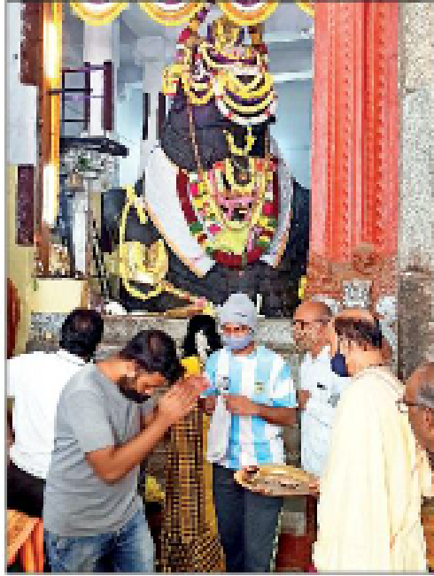
ದೊಡ್ಡ ಬಸವಣ್ಣನಿಗೆ ವಿಶೇಷ ಅಲಂಕಾರ ವಿವರಿಸಲಾಗಿತ್ತು.