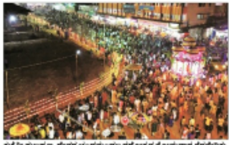
ಕೆ.ಆರ್. ಸುಭಿಷಣ ದೇವರ ಅಂದ್ರಮಂಡಲ ರಥೋತ್ಸವ ಸೋಮವಾರ ನೆರವೇರಿತು.