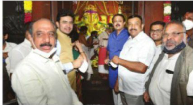
ಕಡಲೆಕಾಯಿ ಪರಿಷೆಯವರ ಪ್ರಯತ್ನ ಬಸವನಗುಡಿಯಲ್ಲಿರುವ ದೊಡ್ಡ ಗಣಪತಿ ಮೂರ್ತಿಗೆ ವಿಶೇಷ ಪೂಜೆ ಕಡಲೆಕಾಯಿಯಾಯಿತು. ಬೆಣೆ ಅಲಂಕಾರ ಕೊಡಲು ಪರಿಷೆಯವರ ಅಲಂಕಾರ ಅಲಂಕಾರ ಗಣಪತಿ ಮೂರ್ತಿ, ಕಡಲೆಕಾಯಿ ಪರಿಷೆ, ಪರಿಷೆ ಕಡಲೆಕಾಯಿ ಪರಿಷೆಯವರ ಪೂಜೆ ಕಡಲೆಕಾಯಿಯಾಯಿತು.

ಕೊರೋನಾ ಸೋಂಕು ಹರಡುವ ಸಾಧ್ಯತೆಯಿಂದ ಬಸವನಗುಡಿಯಲ್ಲಿ ಪ್ರತಿ ವರ್ಷದಂತೆ ಈ ಭಾರಿ ವಿಜೃಂಭಣೆಯಿಂದ ದಕ್ಷ ಬದಿ ಕುಳಿತು, ಅಂಗಡಿ ಮುಂಗಟ್ಟು ಕಡಲೆಕಾಯಿ ಪರಿಷೆಯ ಮೂಲಕ ಮಾಡುವ ಸರ್ಕಾರ ನಿರ್ಬಂಧ ಕಡಲೆಕಾಯಿ. ಓಟಗಾಗಿ ದೇವಸ್ಥಾನ ಸುತ್ತ ಮುತ್ತ ಯಾವುದೇ ಪೂಜಾರವಮಾಡಲು ಕಡಲೆಕಾಯಿ ಪರಿಷೆ, ಅಂಗಡಿ ಮುಂಗಟ್ಟು ಕಡಲೆಕಾಯಿ