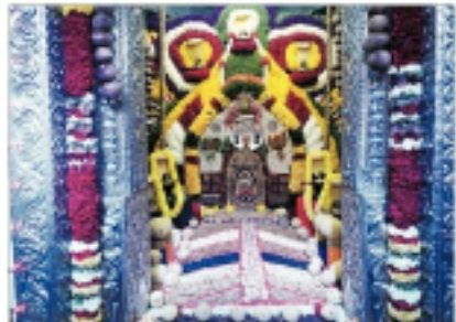
ಮಹಾಲಕ್ಷ್ಮಣೇಶ್ವರ ಶ್ರೀ ಮಂಜುಲಾಭೇಶ್ವರ ಸ್ವಾಮಿ ವಿವಿಧ ಬಗೆಯ ಪೂಜಾಕರ್ಮ ಆಚರಣೆ ಅಂಕಾರ ಮಾಡಲಾಗಿತ್ತು.