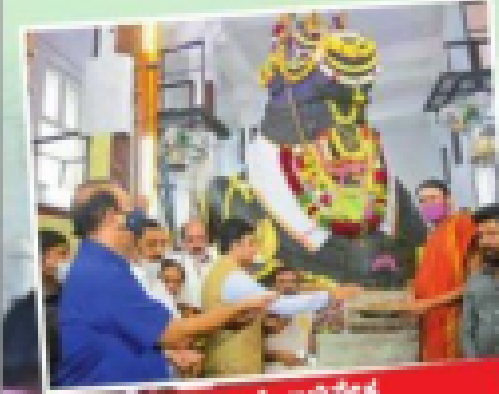
ಬಸವಣ್ಣನಿಗೆ ಕಡಲೆಕಾಯಿ ಅಭಿಷೇಕ.

ದೊಡ್ಡ ಗಣಪತಿಗೆ ಬೆಣ್ಣೆ ಅಲಂಕಾರ ಮಾಡಿ ರುವುದು. ಹಾಗೂ ಬೆಂಗಳೂರು ಕಡಲೆಕಾಯಿ ಪರಿಷೆಯಲ್ಲಿ ಪರಿಷೆ ಅಭಿಷೇಕ ಮಾಡಲಾಗಿದೆ. ಆದರೆ, ಈ ಬಾರಿ ಕೆಲಸವನ್ನು ಅಭಿಯಾಗಿದೆ. ಕೆಲಸವನ್ನು ಕೆಲಸ, ನಿರ್ಮಾಣಗಳಿಗೆ ಅಧಿಕಾರಿ ಪ್ರಾಧಿಕಾರ ಸರಳವಾಗಿ ಪರಿಷೆಯನ್ನು ಅಭಿಯಾಗಿದೆ. ಮುಂದಿನ ವರ್ಷ ಎಲ್ಲರಿಗೂ ಜಮಾತಿಸಿಕೊಳ್ಳುವುದು ಸಂಭವಿಸುವಂತೆ ಅಭಿಯಾಗಲಿ ಎಂದು.